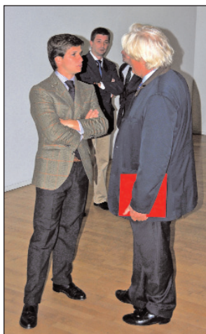
El Juli y el Embajador de Francia.