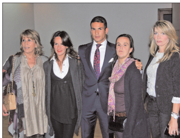
El diestro estuvo arropado por su madre, sus hermanas y su novia.